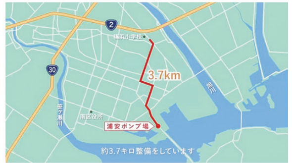
わかるかわる防災 フルバージョン【わかるかわる岡山市Vol.04】