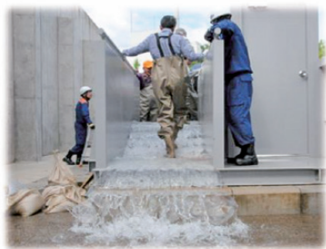
↑ 水災害対応訓練施設イメージ