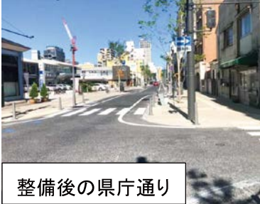
整備後の県庁通り

A 岡山市の歩道整備率は平成 31 年 3 月末時点で 5.2%と全国平均 9.2%を下回っている。新しく整備した県庁通りのように道路空間のユニバーサルデザインに配慮し、段差の少ないセミフラット型で整備している。今後も通行量の多い道路や通学路などで歩道を整備していく