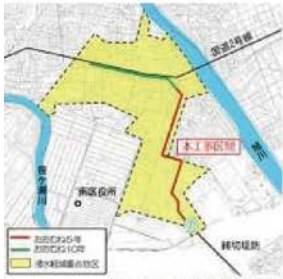
参考：岡山県水防対策計画2019