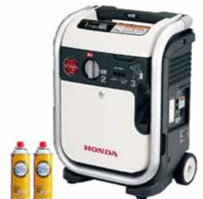
配備されている発電機

A 避難所となる公立の小中学校に配備予定。 平成30年度末では小学校65台、中学校23台配備済。 令和2年度末までに残りの小学校25台、中学校13台配布予定。 (2019年9月定例議会)